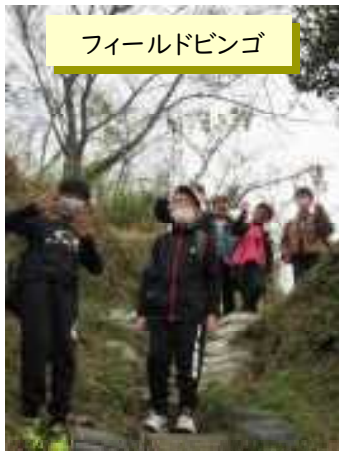
フィールドビンゴ

須高原少年自然の家へ宿泊体験学習に行きました。2日間とも天気に恵まれ、予定通り学習を進めることができました。