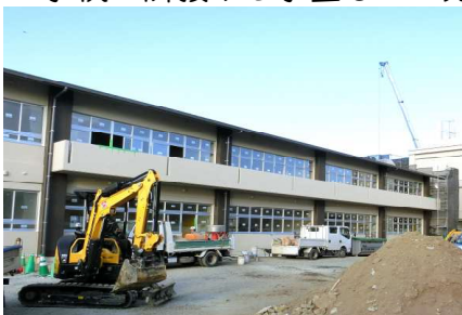
【みさき学園新校舎】